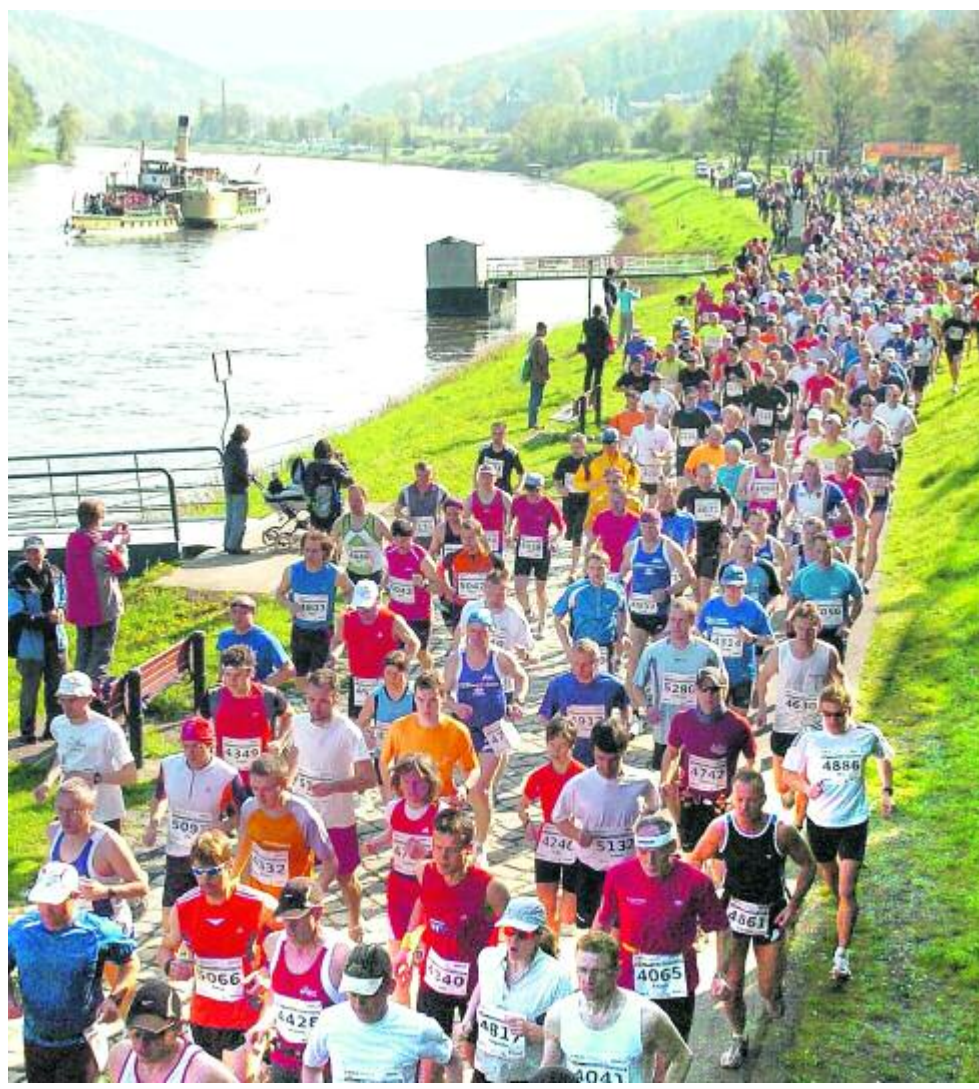
Zum diesjährigen Oberelbe-Marathon erwarten die Organisatoren rund 6000 Aktive.