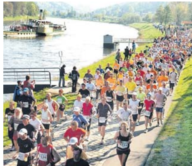
Oberelbemarathon: Kurz nach dem Start in Königsstein. Bei diesem Foto wird deutlich, warum diese Veranstaltung seit Jahren auch als Landschaftslauf punktet.